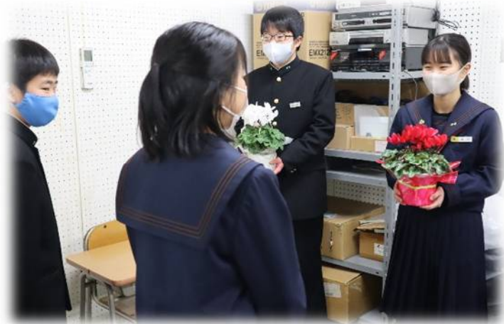
【全校放送による激励会のようす】

後輩、保護者の方、先生方などみなさんにはたくさんの応援団がいます。そういう人達の存在のありがたさに気づき、常に感謝の心を忘れない、そんな人であってください。