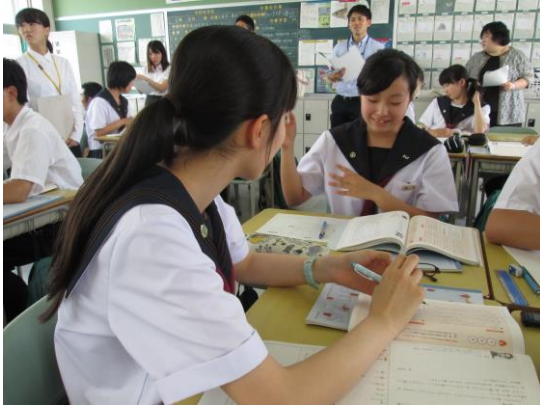
【国語】主体的・対話的に学習に向かう生徒

2年目の令和元年度は、国語・数学・英語の3教科において、本校教員と丸亀高校教員が年複数回の直接交流をしながら共同で授業研究を行っている。特に、中・高の円滑な学びの接続に向けて、互いの授業を参観し合ったり、どのような指導を行うことが今後求められる資質・能力の育成につながるのかを協議し合ったりした。