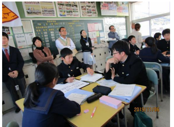
【英語】グループで考えをボードにまとめる