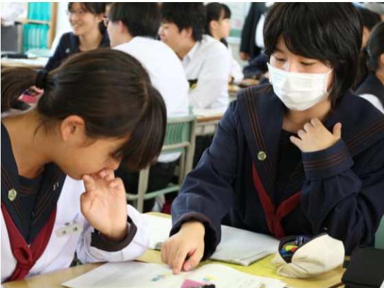
【数学】意見を出し合い深く考えていく生徒