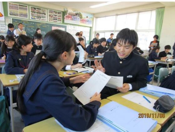
【英語】ペアになって英語で語り合う生徒