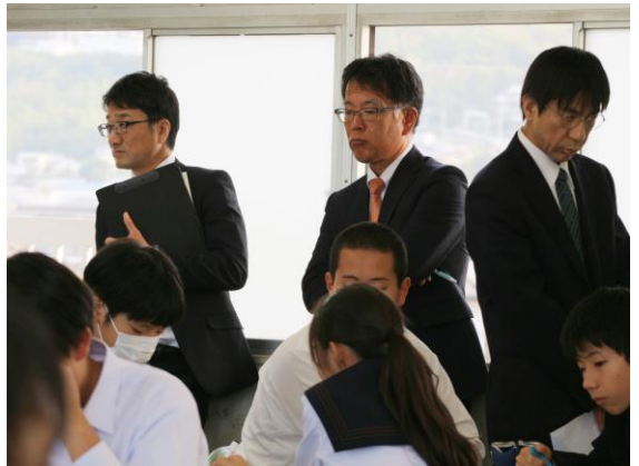
【数学】多くの先生方とともに授業研究