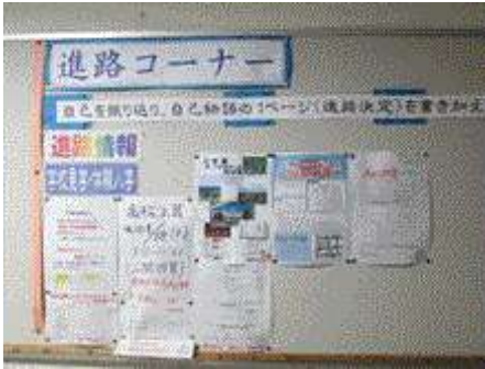
【図書室横の掲示板】

図書室横にある掲示板のことです。そこには、高等学校のオープンスクールの案内やパンフレットなどの進路情報が掲示されています。こまめにチェックしてくださいね。また、今月の団通信にも書きましたが、3年生になると合計7回の学習の診断テストがあります。それらを目標にしてしっかりと学力もつけていってください。