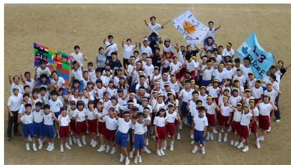
【運動会終了後の1年団集合写真】

運動会を終えて、ほっと一息というところでしょうか…。短い時間の中で完成度の高いものを求めて厳しい練習が続きましたが、上級生とともによく頑張りました。X人Y脚、マスゲーム、そしてグランドフィナーレを迎えたみなさんの顔はととてもたくましく見えました。来年、再来年の成長が楽しみです。さて、今回の運動会を振り返って、どのようなことが心に残りましたか。体育部、生徒会役員をはじめ、運動会の運営にかかわった執行部、暑い中、石拾いやグラウンド整備をしてくれた人たち、夏休みからマスゲーム作りに取り組んだプロジェクトメンバーなど、自分の役割を果たしていた先輩たちの思いを、しっかりと受け継いでください。今回の運動会は皆さんにとっては次へつながる過程です。達成感をもちつつも運動会で学んだことを今後の学校生活に活かし、さらによりよいものを求めて来年も頑張らしましょう！